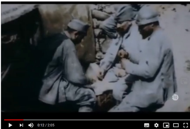
La vie dans les tranchées 2'05

https://www.youtube.com/watch?v=bUlzvG1lvll