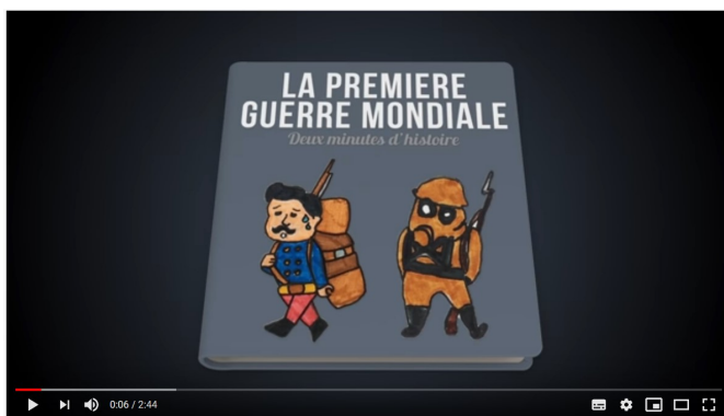
La première guerre mondiale (2 minutes d'histoire)

https://www.youtube.com/watch?v=GBS8kPqpBnE